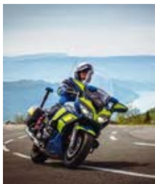
Lieutenant-colonel Charles Bouriot, officier adjoint commandement du groupement de gendarmerie départementale de l'Ain.