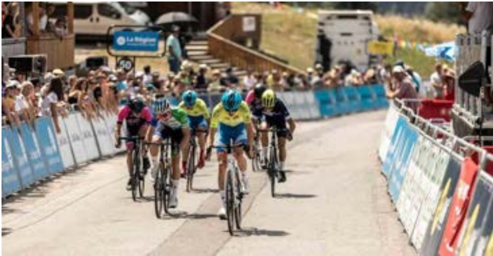
L'arrivée du Tour de l'Ain U17 2022.

Le Tour de l'Ain U17 (cadets) précède les professionnels et se déroule sur le même final d'étape. Cette année, l'étape 1 relie Châtillon-sur-Chalaronne à La Plaine Tonique ; l'étape 2 Ordonnaz-Lagnieu ; l'étape 3 Belleydoux – Léllex Monts Jura. Trente et une équipes sélectionnées dans toute la France, mais aussi à l'étranger seront au départ le 31 juillet. Celles-ci seront composées de 5 coureurs âgés de 15-16 ans. Cette animation sportive, portée par Christian Périchon et Ludovic Dubois, les éducateurs de cyclisme, veut valoriser l'esprit d'entraide et de solidarité. C'est pourquoi, à chaque étape, seule la meilleure équipe du jour est récompensée.