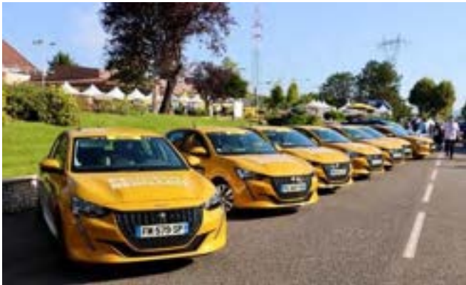
Partenaire depuis plus de trente ans, Peugeot AutoBernard met à disposition de l'organisation une importante flotte de véhicules. Cette année, elle sera composée d'une cinquantaine de véhicules, dont la moitié en motorisation alternative.