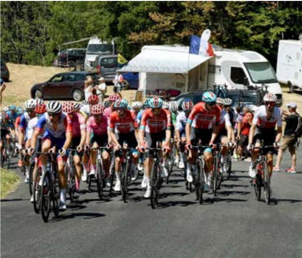
Le peloton dans le col de Portes lors de l'édition 2022.

Arrivée à Lélèx Monts Jura (Centre de la Station) 14 h 00-17 h 00 Ouverture du village-arrivée (stands exposants, animations, espace VIP) 14 h 25 Arrivée Tour de l'Ain U17 15 h 00 Arrivée de la caravane d'animation 15 h 50 Arrivée de la 3e étape 15 h 55 Podium - Cérémonie protocolaire