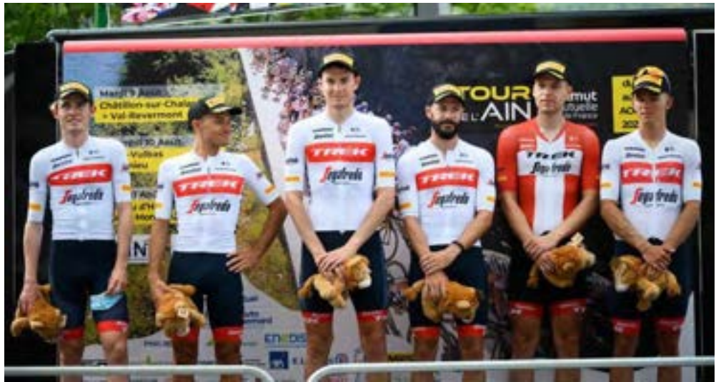
L'équipe Trek avait terminé meilleure équipe en 2022.