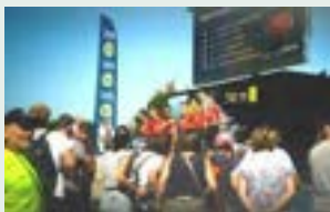
La présentation des équipes peu avant le départ.

Ambiance festive et chaleureuse au cœur du village départ qui regroupe chaque matin, partenaires de l'épreuve, producteurs et artisans locaux réunis pour célébrer ce rendez-vous sportif. Il accueille aussi les padocks des équipes. Peu avant le départ, le public peut assister à la présentation des coureurs. Stationnés à proximité, les véhicules événementiels