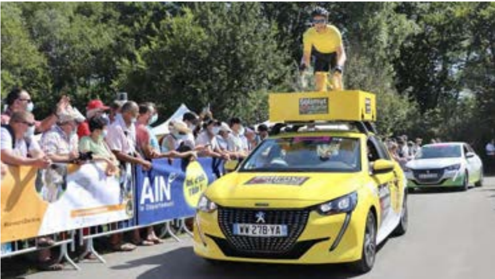
Cette année encore, les spectateurs pourront profiter du passage de la caravane publicitaire.